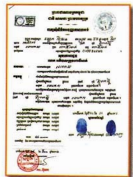
☑ ពាក្យស្នើសុំសាងសង់