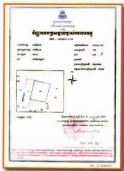
☑ ប័ណ្ណសម្គាល់កម្មសិទ្ធិ